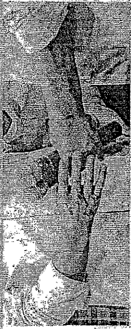
CAMILLO e Cid têm atuado nas articulações